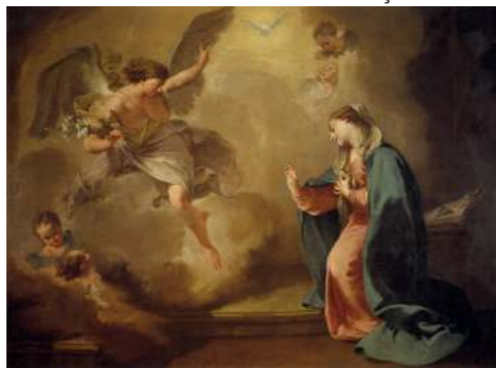
O "fiat" de Maria, na Anunciação, tem a sua plenitude no "fiat" silencioso que Ela repete ao pé da cruz. Ser fiel é não atrair nas trevas aquilo que se aceitou em público (São João Paulo II).

É conveniente que o anúncio dos diversos mistérios seja acompanhado por breves trechos da Bíblia sobre o mistério enunciado, para assim favorecer a memorização de algumas expressões significativas da Escritura relativas aos mistérios da vida de Cristo. Além disso, o Sínodo recomendou que se promova entre os fiéis a recitação da oração do Angelus Domini . Trata-se de uma oração simples e profunda que nos permite «recordar diariamente o Verbo Encarnado». É oportuno que o Povo de Deus, as famílias e as comunidades de pessoas consagradas sejam fiéis a esta oração mariana, que a tradição nos convida a rezar ao alvorecer, ao meio-dia e ao entardecer. Na oração do Angelus , pedimos a Deus que, pela intercessão de Maria, nos seja concedido também cumprir a vontade de Deus como Ela e acolher em nós a sua Palavra. Esta prática pode ajudar-nos a intensificar um amor autêntico ao mistério da Encarnação.